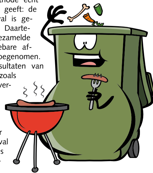
Alle etensresten mogen in de groene kliko!

De resultaten laten zien dat de huidige inzamelmethode echt positieve resultaten geeft: de hoeveelheid restafval is gedaald met 35%. Daartegenover is de ingezamelde hoeveelheid recyclebare afvalstromen enorm toegenomen. Ook de inzamelresultaten van overige stromen, zoals KCA en glas, zijn verbeterd. De huidige inzamelmethode maakt inwoners blijkbaar meer bewust van de manier waarop ze met afval omgaan. En dat is een groot compliment aan u waard!