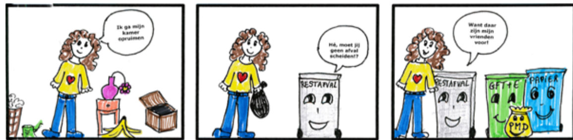
Vorig jaar organiseerden de Greenkids een striptekstwedstrijd over afvalinzameling. Amber F zat toen in groep 6 C van basisschool Dick Bruna. Zij tekende deze strip.