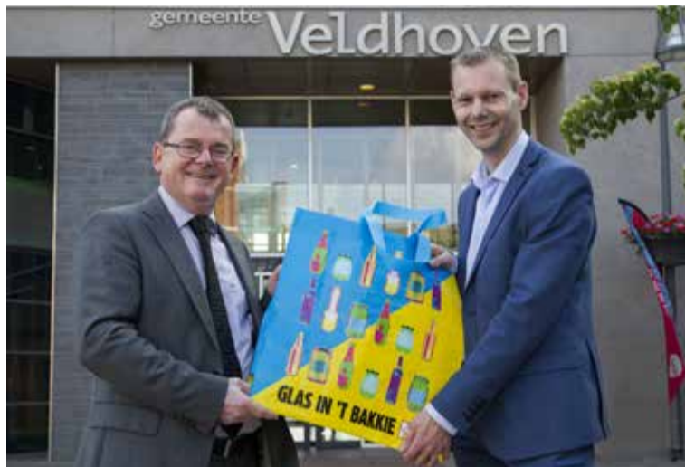
Nieuwsgierig naar de tas op deze foto? Lees dan de themapagina Glasnieuws!