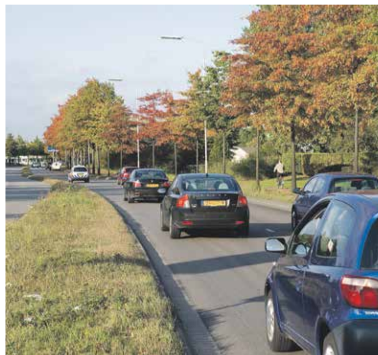
Het plan is om de Kempenbaan te ontwikkelen tot 2x2 rijstroken in beide richtingen en aan te sluiten op de A67 aan de westkant en de N2 aan de oostkant