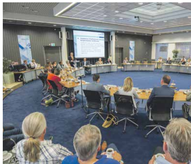
Commissaris van de Koning Wim van de Donk spreekt de raad toe